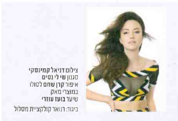
סגנון שילי נסים איפור קרן שחם לסולו במוצרי מאק שיער בועז עוזרי ביגוד: רנואר קולקציית מסלול