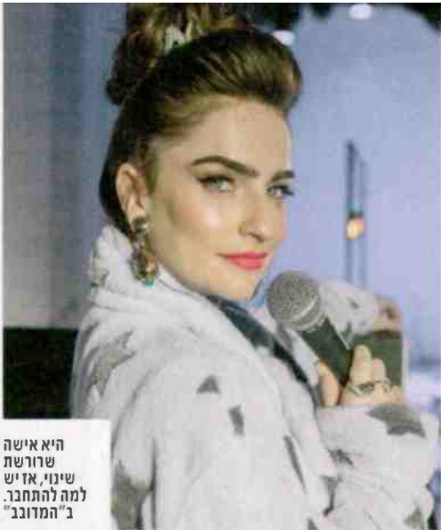
היא אישה שורשת שינוי, אזיש למה להתחבר ב"המדובב"