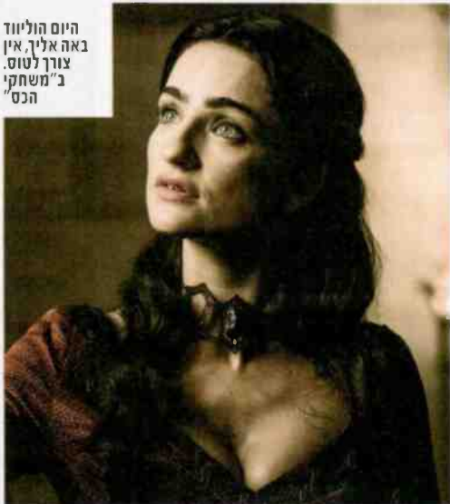
היום הוליווד באה אליך, אין צורך לטוס ב"משחקי הכס"