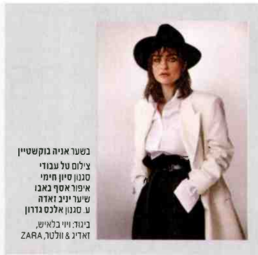
בשער אניה בוקשטיין סגנון סיון חימי איפור אסף כאבו שיער יניב זאדה ע. סגנון אלכס גדרון ביגוד: ווי בלאיש, זאדיג & וולטר, ZARA

קול חתן וקול חתן מר עכבר נישא לבן זוגו בסדרה "אתור" אבל עוד לפניו היו לילדים תכני אנימציה מלאים ברמזים להטב"קים (היוש, אלזה מ"פרוזן") יצאנו לחקור