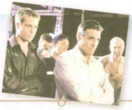
2007 אוסקר ראשון בקטגוריית שחקן המשנה הטוב ביותר, על תפקידו ב"סוריאנה". ב־2013 יזכה שוב, באוסקר לסרט הטוב ביותר, עבור "ארגו". ב־2007 יצא "אושן 13", השלישי והאחרון בסדרה המצליחה בכיכובו