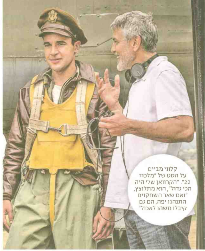
קלוני מביים על הסט של "מלכוד 22". "הקרוואן שלי היה הכי גדול", הוא מתלוצץ, "ואם שאר השחקנים התנהגו יפה, הם גם קיבלו משהו לאכול"