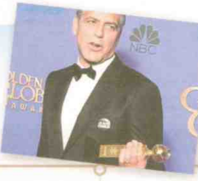
2015 מקבל את פרס גלובוס הזהב על שם ססיל ב. דה־מיל על מפעל חיים

אמל עשתה לעצמה שם כעורכת דין הניצבת בחזית המאבק לזכויות אדם. היא סיעצה לנשים יזריות רבות, ביניהן אישה בשם נריה מוראר, שהייתה שפחת מין של פעילי דאע"ש. בני הזוג קלוני אף 'אימצו' את הפליט היוזרי חוים אדבל,