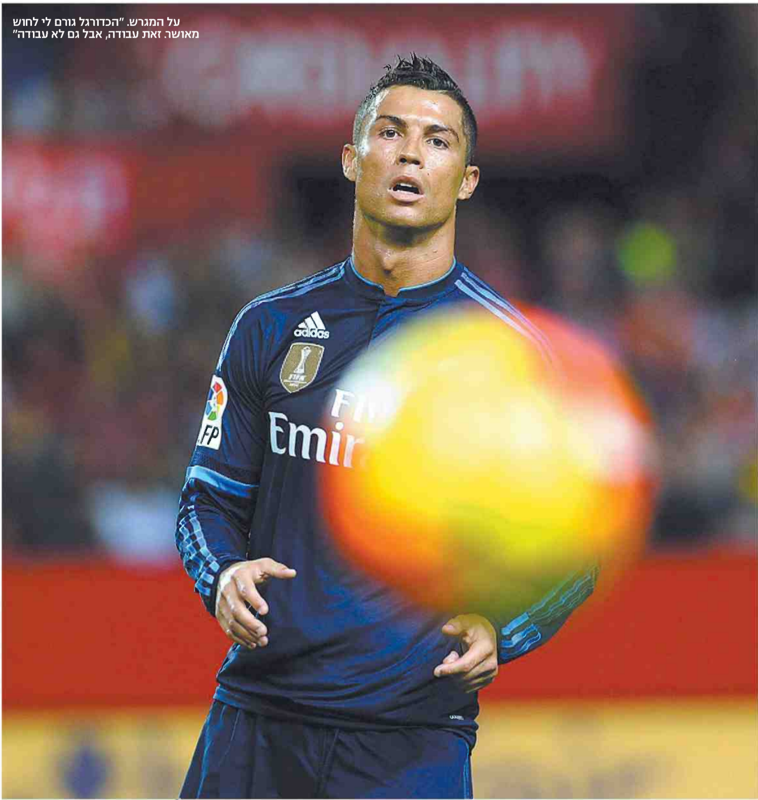
על המגרש. "הכדורגל גורם לי לחוש מאושר. זאת עבודה, אבל גם לא עבודה"

"לא אכפת לי שאנשים שונאים אותי, כי זה דוחף אותי קדימה. במשחקי חוץ אנשים תמיד נגדי, אבל זה טוב. אני צריך את האויב, זה חלק מהעסק. ברגע שאני נוגע בכדור, מתחילים לצרוח. זו לא בעיה בשבילי, להפך. זה גורם לי למוטיבציה"