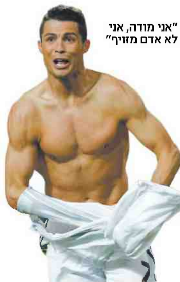
"אני מודה, אני לא אדם מזויף"

"לפעמים אני אוכל דברים שלא טובים לי. שותה כוס יין. בכל יום ראשון אנחנו אוכלים המבורגרים בבית ושותים קוקה קולה וכל זה. צריך לשמור על איזון. הגיל מעניק לך את הידע. נשימות עמוקות עוזרות לי מאוד כשאני מרגיש מתוח"