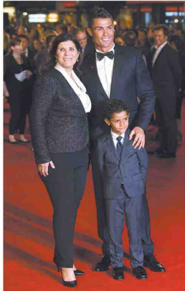
עם אמו, מריה, ובנו, כריסטיאנו ג'וניור, בלונדון. "הבן שינה אותי"

הסצנות שהן אולי המעניינות ביותר בסרט הן אלו שצולמו בביתו, עם כריסטיאנו ג'וניור, בנו בן ה־5. הם יושבים יחד על ספה וצופים בטלוויזיה, חול־קים ארוחת בוקר ומדברים על החיים באופן מודע למדי, אבל נוגע ללב. את זהותה של האם הוא לא חשף מעולם, והשמועות אומרות ששילם סכומי כסף אדירים כדי לקבל משמורת בלעדית על בנו. צהובון